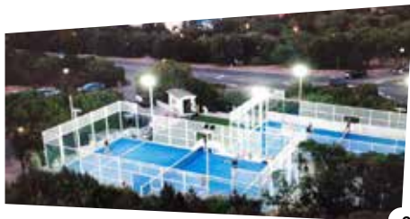
1. Skg arena; 2. Padel Deer, le strutture che ospitano il torneo

blica istruzione, ad Aics, Ordine dei giornalisti, Ussi, Coni, FederCusi, comuni di Arzachena, Tempio e Cagliari, Sport e salute, Università di Cagliari, Lega calcio serie B, Lega nazionale dilettanti, Rai sport, Rai Sardegna e Cipnes: una serie di onorevoli e lusinghieri patrocini. Testimonianze di