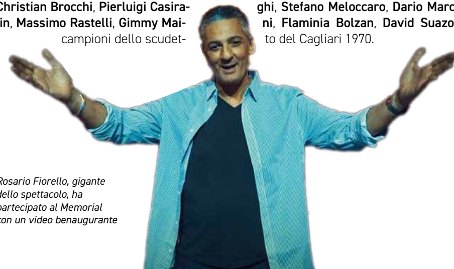
Rosario Fiorello, gigante dello spettacolo, ha partecipato al Memorial con un video benaugurante