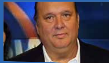
Giampiero Galeazzi. Nato a Roma il 18 maggio 1946 e scomparso il 12 novembre 2021. Aveva 75 anni

ma fece un miracolo: alla convention sui formaggi sardi arrivarono alla sala del Marriott duecento giornalisti. Che lo applaudirono anche per la sua improvvisata partecipazione al concerto dei Cordas et Cannas.